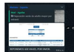
Soporte en sistema