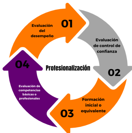
Figura 2. Certificado Único Policial (CUP)

Por lo que, dentro de los proyectos estratégicos del PEGD, para el eje de Seguridad, Justicia y Estado de Derecho, se incluye la implementación del Certificado Único Policial (CUP) (Figura 2). Este proyecto abarca el ingreso y la permanencia de personal que posea el perfil, habilidades, aptitudes y confiabilidad necesarios para desempeñar funciones fundamentales en las Instituciones de Seguridad Pública, Procuración de Justicia y el Sistema Penitenciario 43 . De esta manera, se busca garantizar que dicho personal haya sido debidamente capacitado y evaluado de manera oportuna. Así, el PEGD se alinea con este PPN, cuyo propósito es fortalecer a los miembros de las instituciones de seguridad pública mediante diversos mecanismos que permitan evaluar los niveles de seguridad, confiabilidad, eficiencia y competencia del personal.