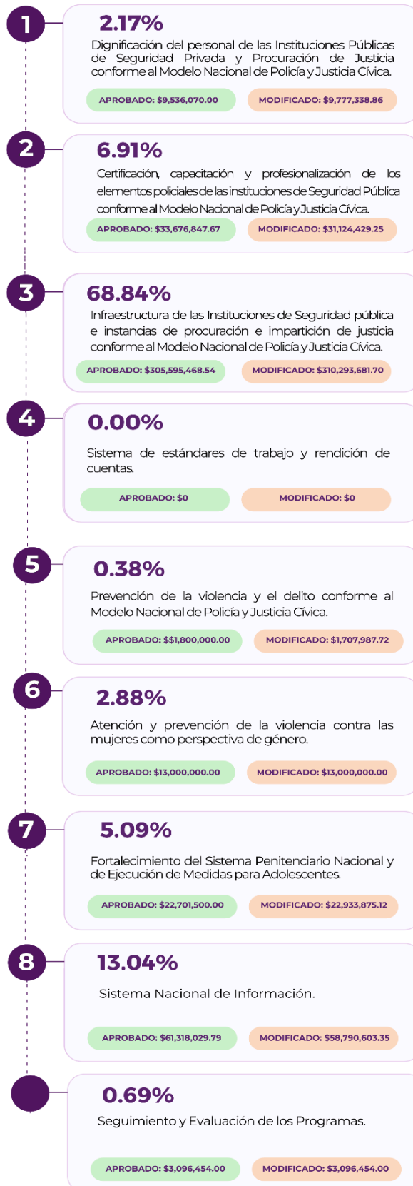
Figura 1. Distribución de recursos del financiamiento conjunto por Programa con Prioridad Nacional